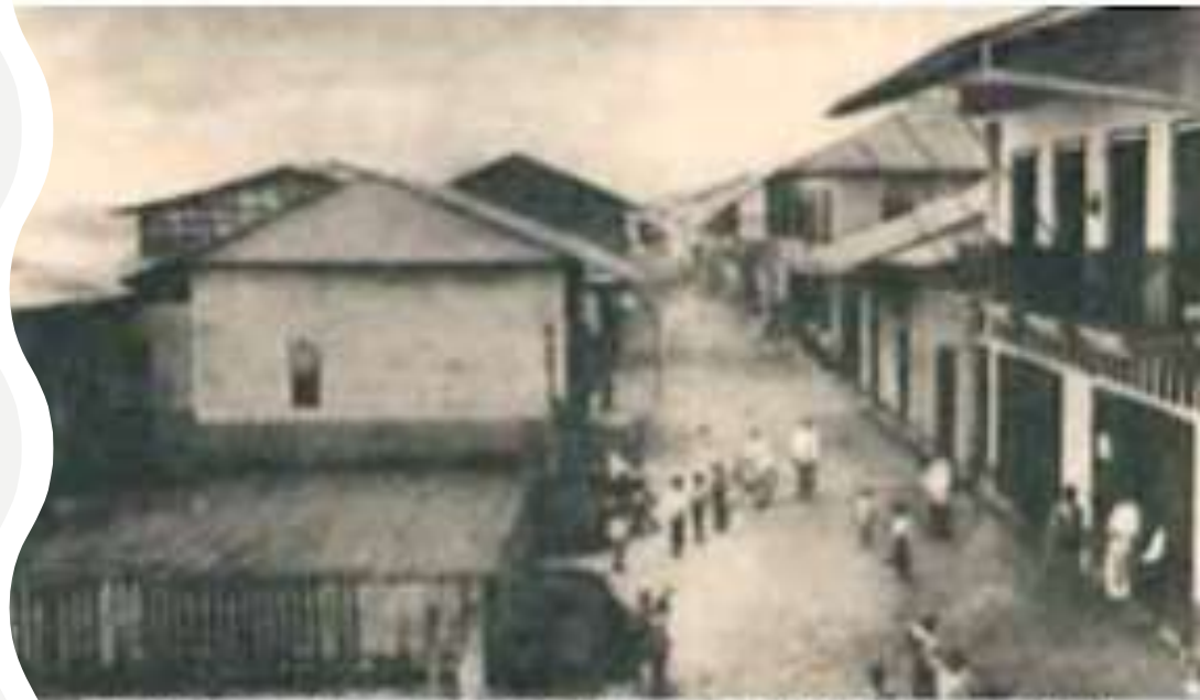
Tumaco: como estaba en la época del Milagro de 1906